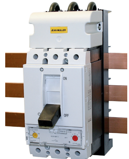
Geräteadapter mit Leistungsschalter Device adapter with circuit breakers